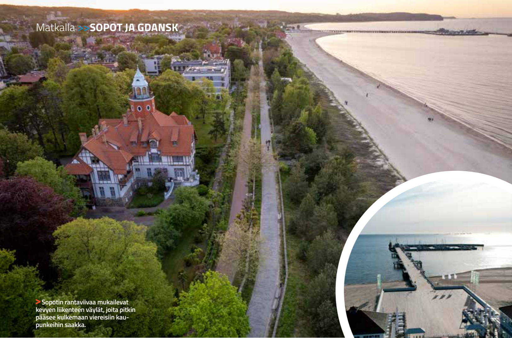
> Sopotin rantaviivaa mukailevat kevyen liikenteen väylät, joita pitkin pääsee kulkemaan viereisiin kaupunkiin saakka.