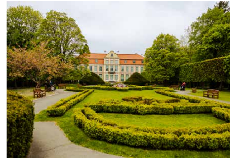
AV Oliwskin puisto sijaitsee Gdanskin ja Sopotin rajalla. Kaunis ja vehreä paikka toimi aiemmin luostarin pihamaana.

Ravintolan hienous ei silti perustu pelkkään ruoka- ja juomatarjontaan, vaikka ne ensiluokkaisia ovatkin. Melkeinpä suurin poikkeus kotimaiseen ravintolakulttuuriin löytyy todella hyvästä palvelusta. Vaikka seurueemme ei koreile hienolla vaatetuksella, saamme serviisiä, joka hakee vertaistaan. Kommunikaatiokin asiakkaan kanssa on korrektaa, hauskaa ja henkilökohtaista, mikä nostaa elämyksen vielä uudelle tasolle.