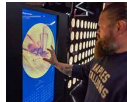
▲ Meripihkan sisään on hautautunut hyönteisiä. Vanhimmat niistä ovat peräisin jurakaudelta.