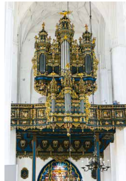
◀ Pyhän Marian kirkko on Gdanskin tärkeimpiä nähtävyyksiä. Rakennus on täynnä toinen toistaan kauniimpia taide-esineitä.