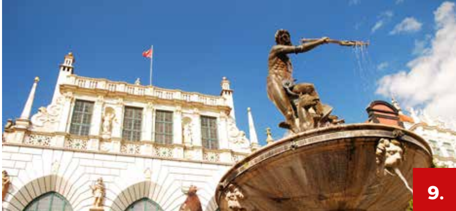
fol. Mateusz Ochocki