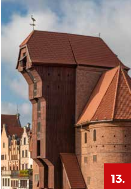
fol. Paweł Jozwiak

Miejska brama, portowa twierdza i dwa dźwigi jeden nad drugim – tak w skrócie opisać można gdańskiego Żurawia. To jeden z najcenniejszych zabytków historycznego śródmieścia. Powstał w połowie XV wieku jako jedna z dziewięciu bram wodnych, które prowadziły ku rzece Motławie. Potężne baszty po obu stronach bramy, przystosowane do niewielkiej artylerii, mogły skutecznie bronić rzeczno-portu. Na tej obronnej strukturze zamontowano wysuniętą w kierunku rzeki drewnianą konstrukcję podwójnego dźwigu. Ten mechanizm, napędzany siłą ludzkich mięśni, używany był do portowych przeładunków (niższy hak) oraz do ustawiania masztów na statkach (górny hak). Maksymalna nośność całego urządzenia wynosiła 4 tony, które można było unieść na wysokość 11 metrów. Odbudowany ze zniszczeń wojennych Żuraw mieści obecnie oddział Narodowego Muzeum Morskiego, do którego należą sąsiadujący Ośrodek Kultury Morskiej oraz znajdujące się na przeciwnym brzegu Motławy, na wyspie Ołowiance, spichlerze i statek-muzeum „Sołdek”. Po zakończeniu