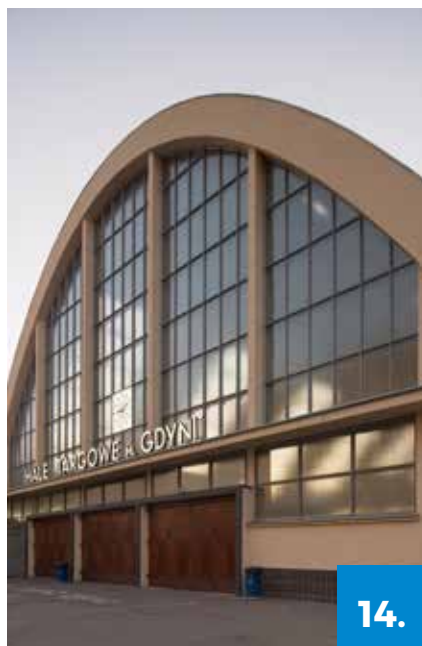
fort. B. Pomikiewski

Nowoczesne hale targowe wybudowano w latach 1935–1938 według projektu Jerzego Müllera i Stefana Reychmana. Na zespół składały się: największa hala łukowa (owocowo-warzywna), połączona z płaską halą mięsną w kształcie litery L, i osobna hala rybna. Podczas wojny hale były wykorzystywane przez Niemców jako magazyny części i elementów konstrukcyjnych samolotów. Po wojnie przywrócono im funkcję handlową, a z czasem gdyńskie hale stały się miejscem kultowym, gdzie można było nabyć zachodnie produkty przywożone przez marynarzy. Ze względu na swoje walory konstrukcyjne i architektoniczne w 1983 roku Hale Targowe w Gdyni zostały wpisane do rejestrów zabytków jako doskonały przykład nurtu konstruktywizmu w polskiej architekturze. Miejsce to tętni życiem od wczesnych godzin porannych do późnego popołudnia, a szeroki asortyment przyciąga tłumy mieszkańców i turystów.