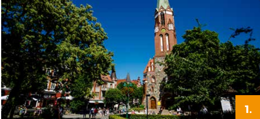
fol. Matusz Ochocki