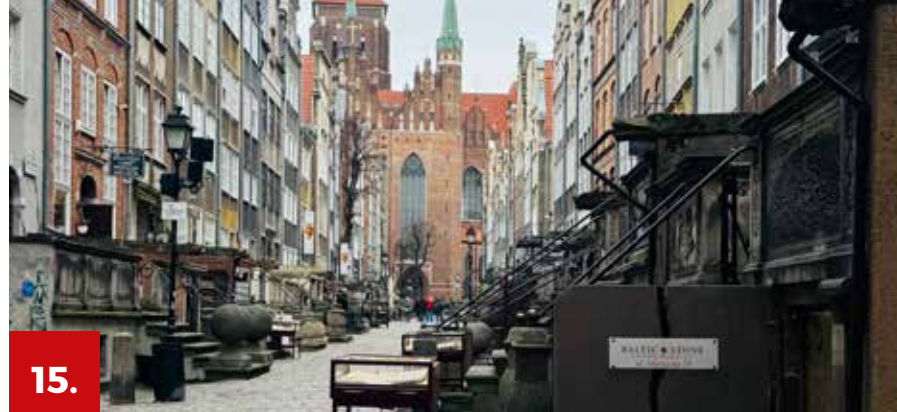
fol. Agnieszka Chapirońkowska

Wznoszony przez ponad półtora wieku kościół Mariacki jest największą ceglana świątynią w Europie. Jej gotyckie wnętrza o wyjątkowo pięknych i wysokich sklepieniach kryje wiele dzieł sztuki od średniowiecznych po współczesne, m.in. przebogaty ołtarz główny, dzieło mistrza Michaela Schwarza z Augsburga, wzruszającą kamienną Pietę z ok. 1410 roku, kopię tryptyku „Sąd Ostateczny”, słynny zegar astronomiczny Hansa Düringera. Doskonała akustyka surowych, ascetycznych murów kościoła podkreśla piękne brzmienie wspaniałych barokowych organów, których prospekt pochodzi z kościoła św. Jana. Ze szczytu imponującej 78-metrowej wieży, której charakterystyczna, tępo zakończona sylweta dumnie wznosi się nad Gdańskiem, roztacza się wspaniały widok na panoramę miasta i okolicy. Aby ją zobaczyć, trzeba pokonać ponad czterysta stopni.