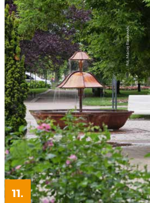
fot. Maciej Raszewski

Łazienki są jednym z najlepiej rozpoznawalnych zabytków Sopotu. Powstały w miejscu wcześniejszych przebieralni dla pań w 1907 roku w miejscu wcześniejszych przebieralni dla pań. Piękny drewniany budynek w ludowym stylu norweskim wzniesiono według projektu Paula Puchmüllera. Od strony morza znajdowały się pomosty z przebieralniami dla pań i rodzinnymi oraz dla panów w układzie podkowy, zaś od strony promenady salony fryzjerskie, restauracje i kawiarnie, które czynne były tylko w sezonie letnim. Budynek przetrwał rok 1945, a przed całkowitym zniszczeniem uratowała go umowa z miastem na trzydziestoletnią dzierżawę przez chińską firmę Min Hoong, która zajęła się remontem i przebudową na potrzeby hotelu.